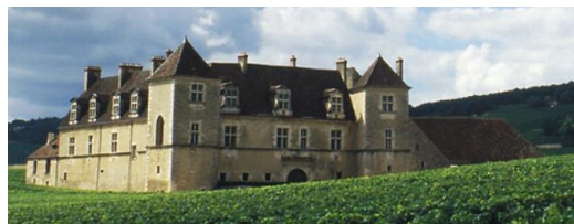
Monument historique d'exception, le Clos Vougeot est le Chef-d'ordre de la Confrérie des Chevaliers du Tastevin.

Situé au cœur de la route des Grands Crus, le château du Clos de Vougeot est le symbole de près d'un millénaire d'Histoire de la Bourgogne.