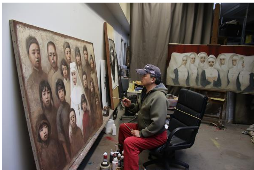
Yin Xin dans son atelier parisien réalisant deux œuvres suite à sa visite à Beaune en 2019. © Yin Xin

Œuvres de l'artiste contemporain Yin Xin